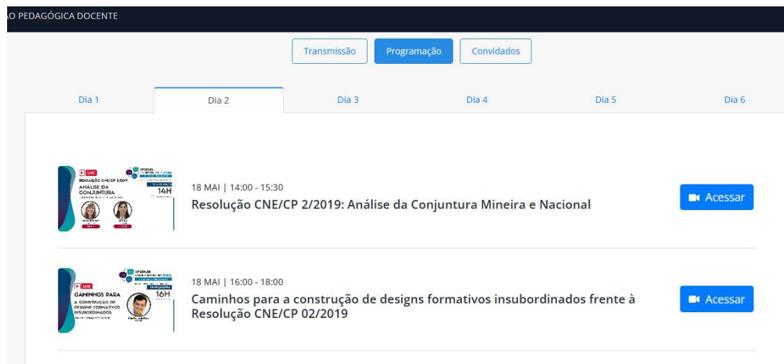
FIGURA 3 - Tela de transmissão online da página do VII Seminário FORPED, no EVEN3