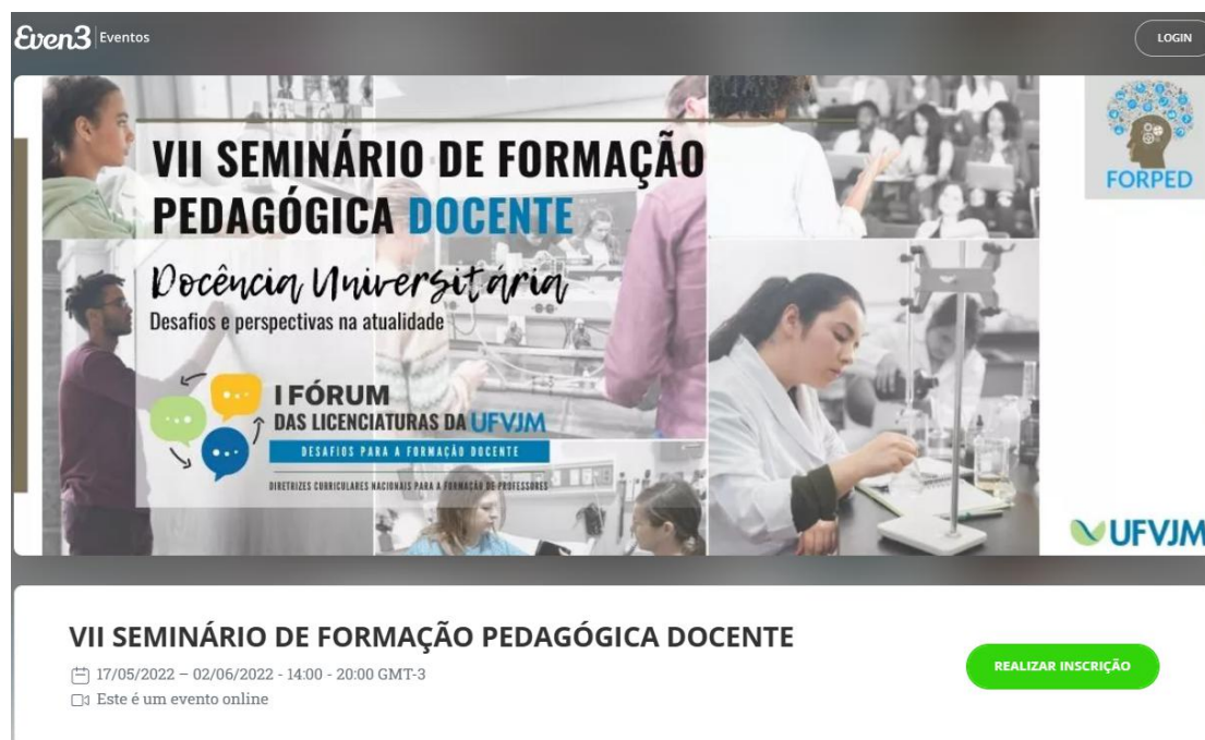
FIGURA 1 - Página do VII Seminário FORPED, criada para divulgação da programação, dos professores convidados e para as inscrições