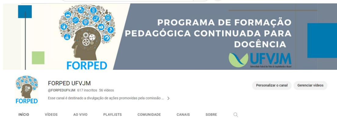
FIGURA 2 - Capa do canal FORPED no YouTube