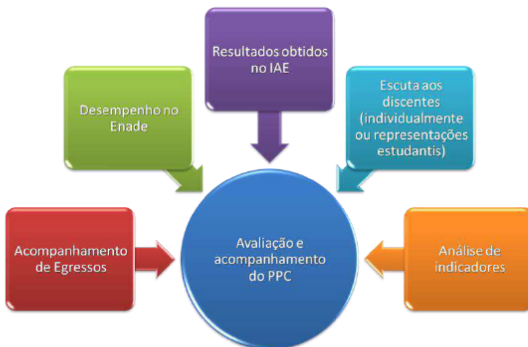
Figura 6 - Estratégias para desenvolvimento do processo de avaliação e acompanhamento do Projeto Pedagógico do Curso de Engenharia de Produção.

A Figura 6 apresenta as estratégias a serem utilizadas para desenvolvimento do processo de avaliação e acompanhamento do Projeto Pedagógico do Curso de Engenharia de Produção na UFVJM.