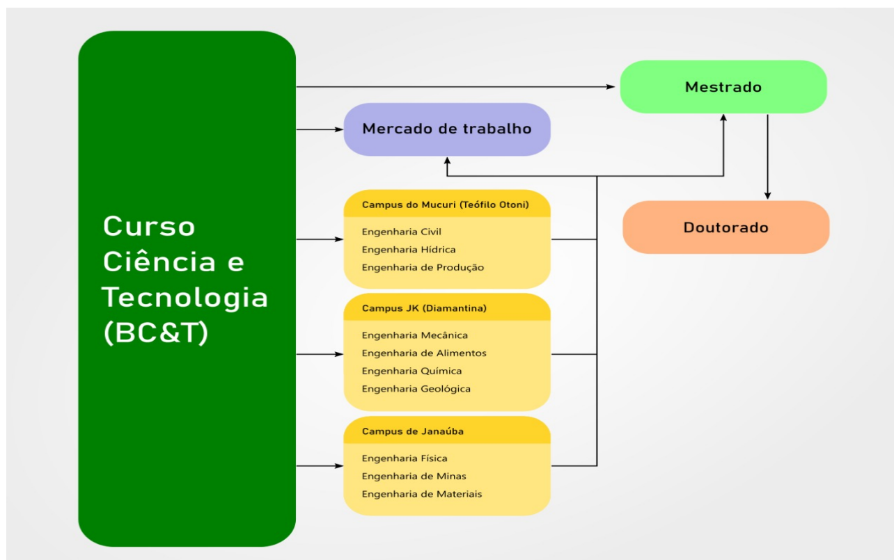
Figura 1: Percursos acadêmicos possíveis aos discentes do BC&T.

O segundo ciclo de estudos, de caráter opcional, estará dedicado à formação profissional em áreas específicas do conhecimento. O terceiro ciclo compreende a pós-graduação Stricto sensu , que poderá contar com alunos egressos do BC&T.