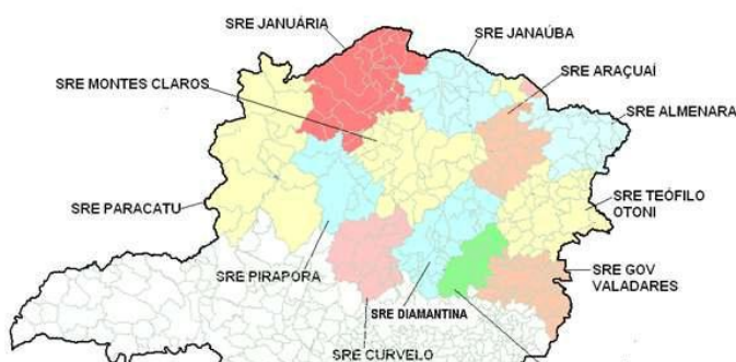
Figura 1 - Região geográfica do Estado de Minas Gerais, área de abrangência da UFVJM - SRE