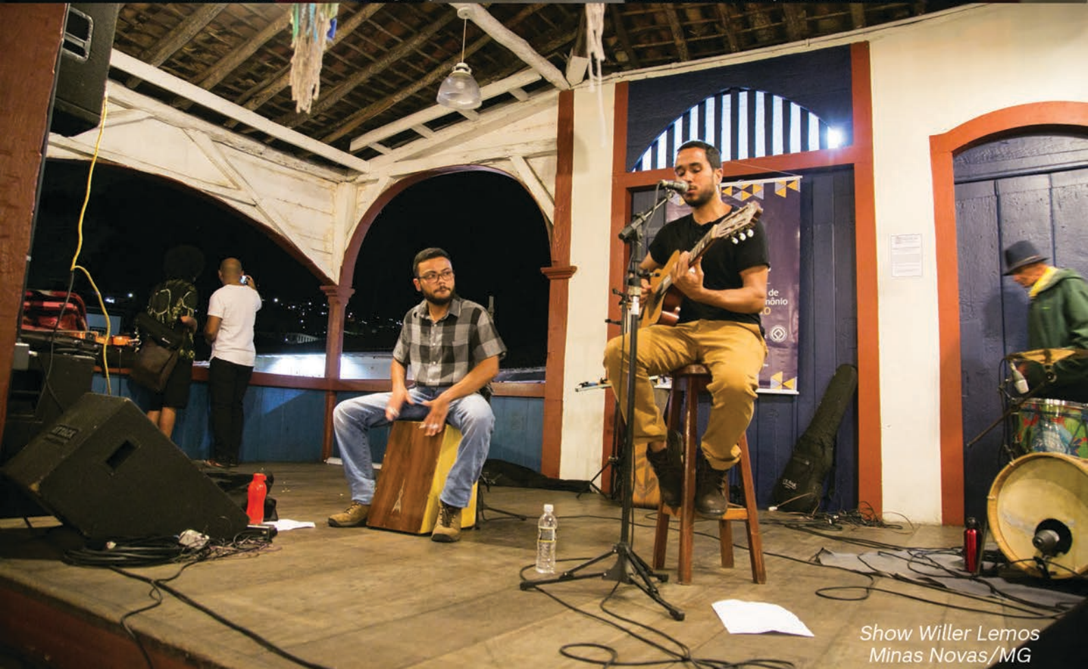
Show Willer Lemos Minas Novas/MG

Assessoria de Comunicação | I Encontro de Cultura e Arte da UFVJM | Lucas Martins