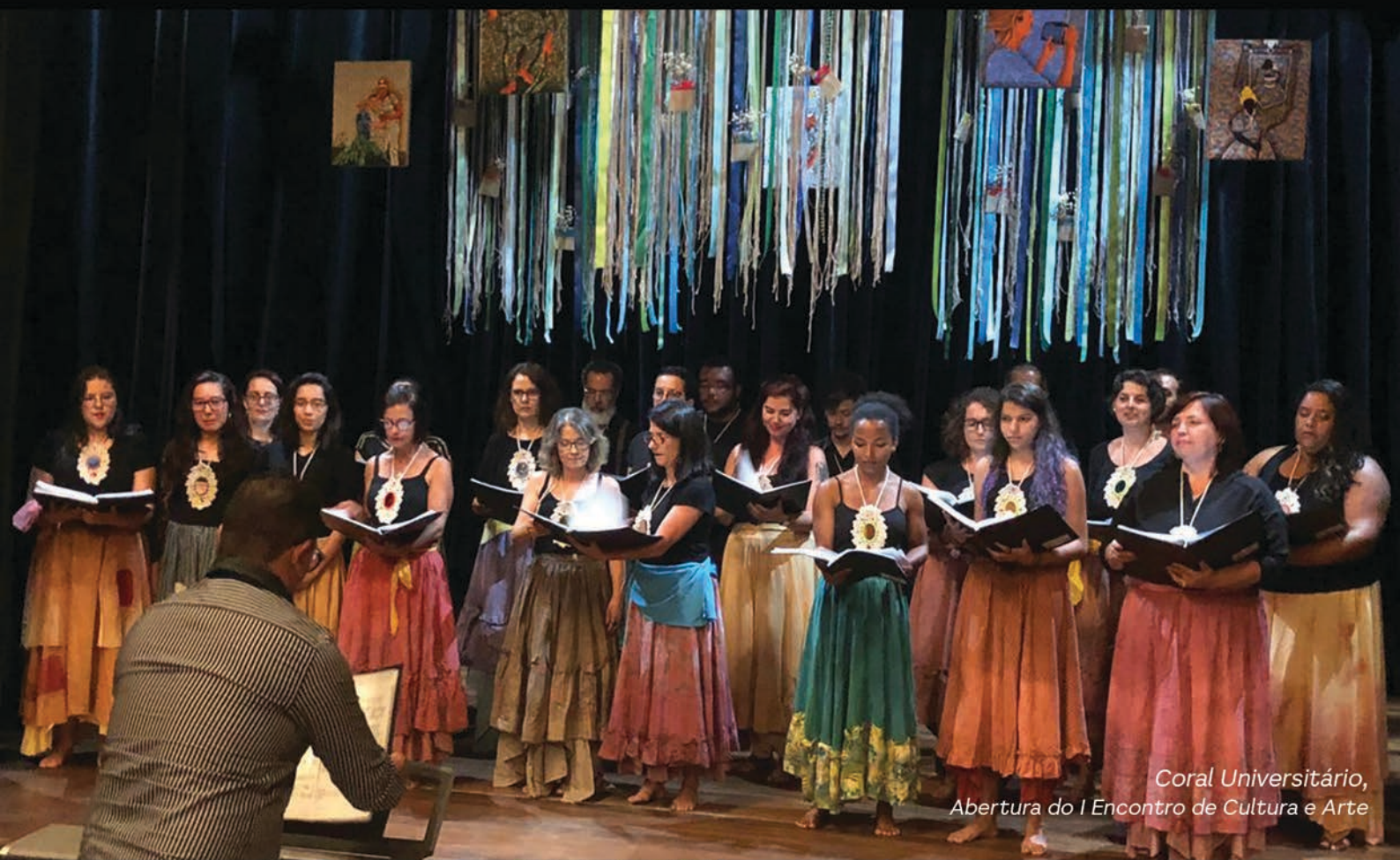
Coral Universitário, Abertura do I Encontro de Cultura e Arte