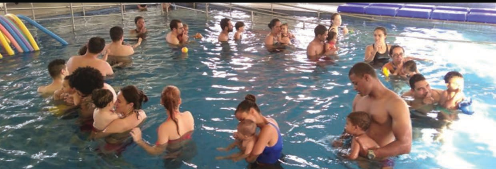
Nada Melhor: estimulação aquática para bebês Coordenação: Wellington Gomes