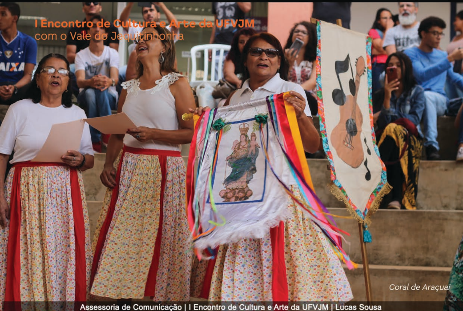
Coral de Araçuaí

Assessoria de Comunicação | I Encontro de Cultura e Arte da UFVJM | Lucas Sousa