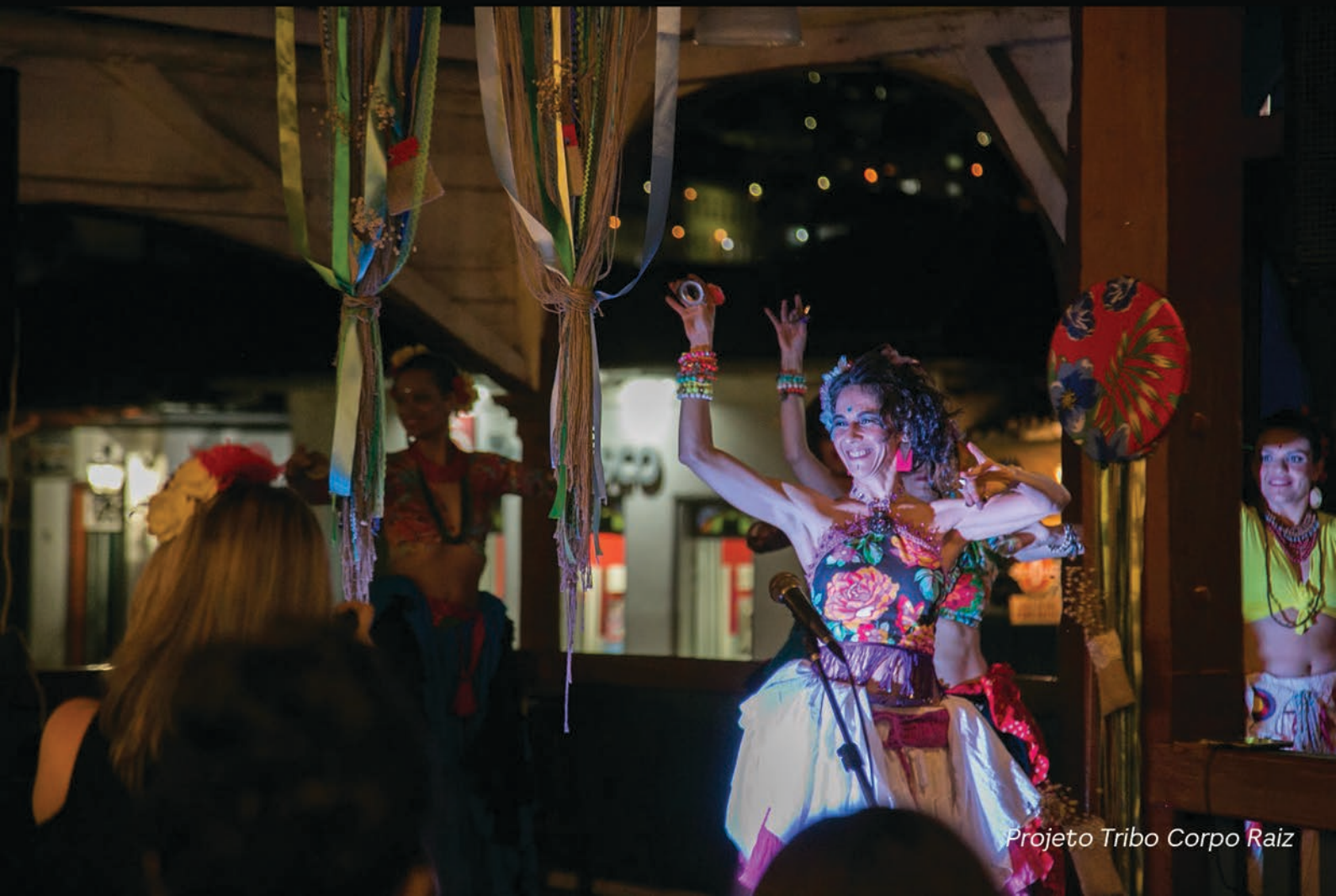
Projeto Tribo Corpo Raiz

Assessoria de Comunicação | I Encontro de Cultura e Arte da UFVJM | Lucas Martins