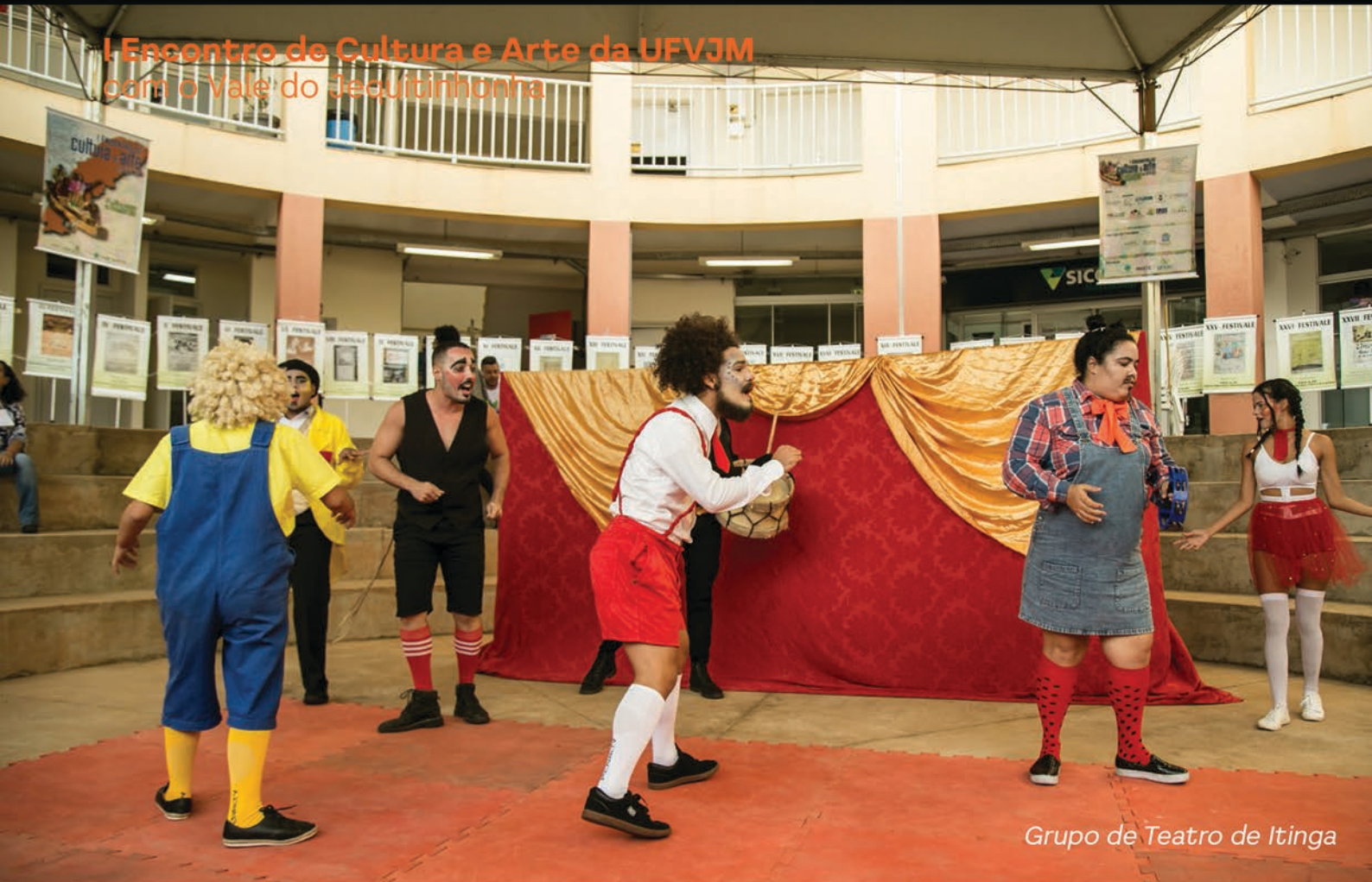
Grupo de Teatro de Itinga

Assessoria de Comunicação | I Encontro de Cultura e Arte da UFVJM | Lucas Martins