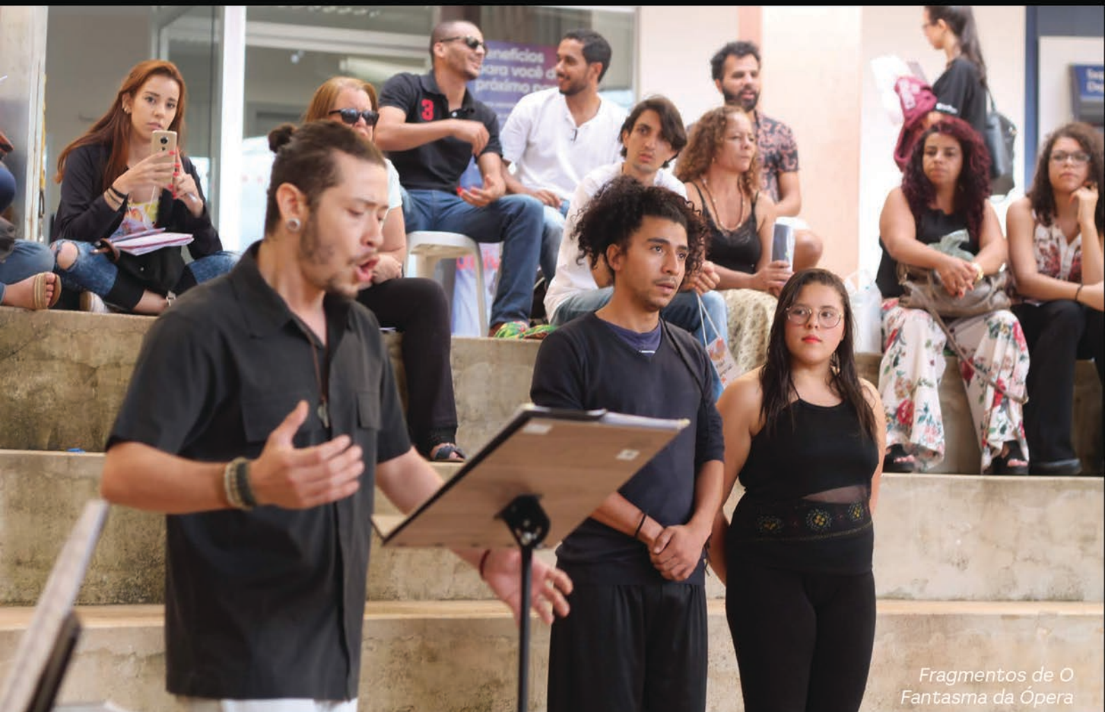
Fragments de O Fantasma da Ópera

Assessoria de Comunicação | I Encontro de Cultura e Arte da UFVJM | Lucas Sousa