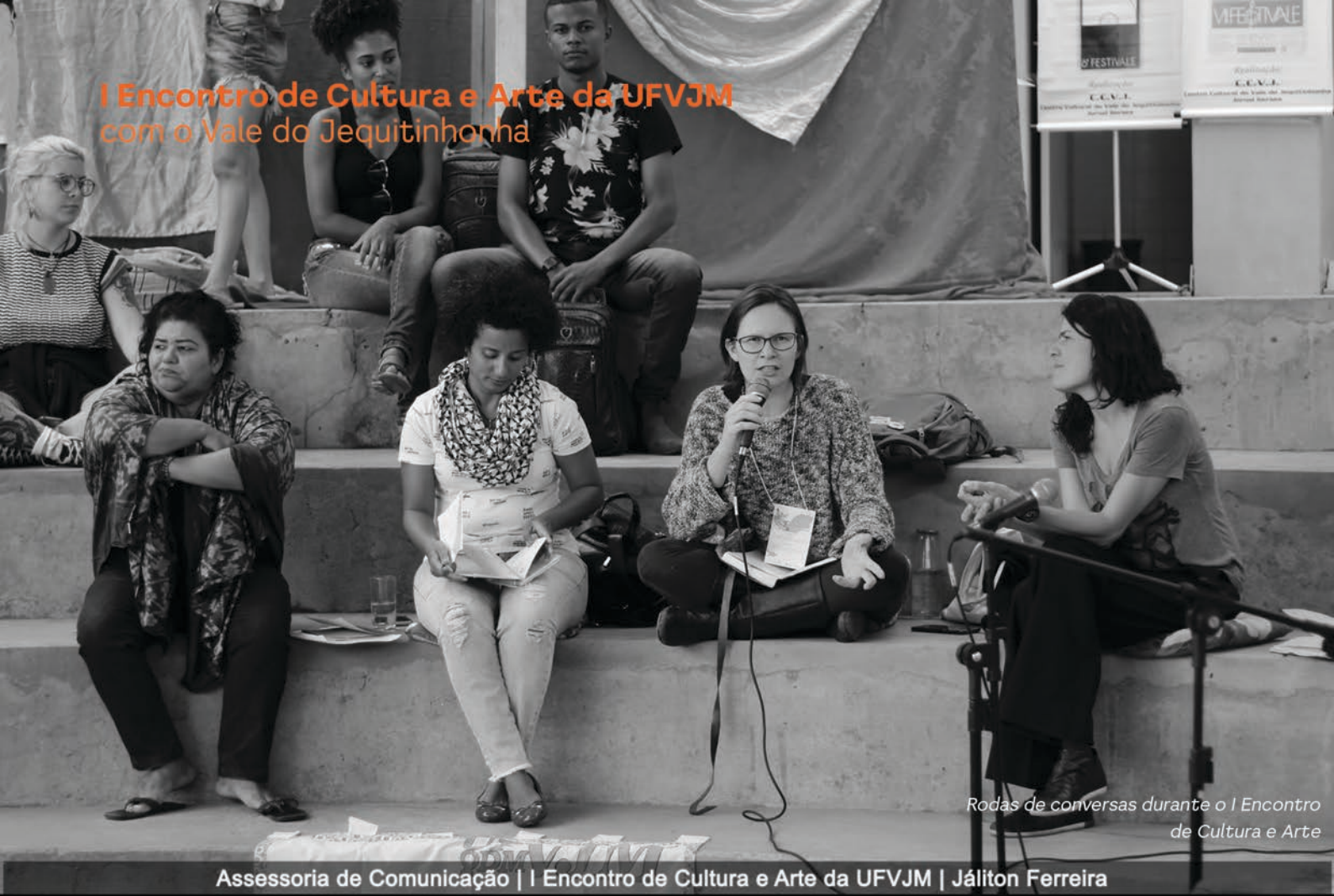
Rodas de conversas durante o I Encontro de Cultura e Arte

Assessoria de Comunicação | I Encontro de Cultura e Arte da UFVJM | Jáliton Ferreira