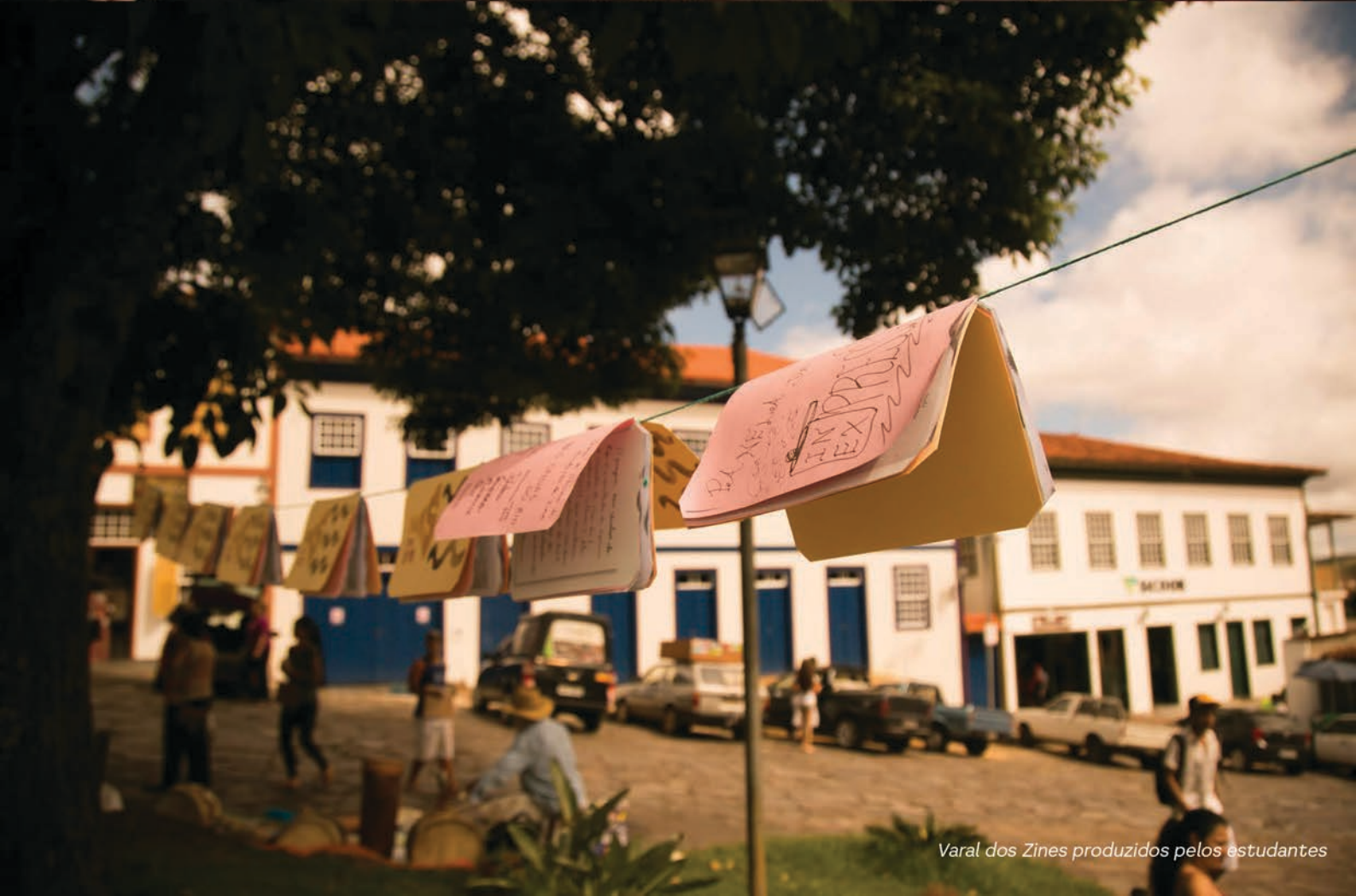
Varal dos Zines produzidos pelos estudantes