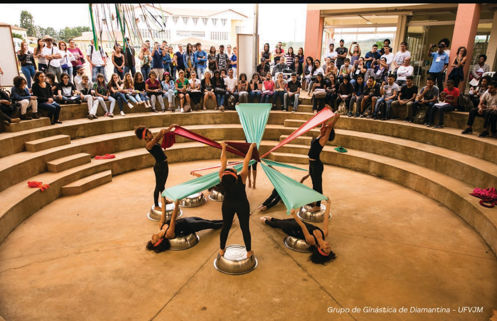
Grupo de Ginástica de Diamantina - UFVJM