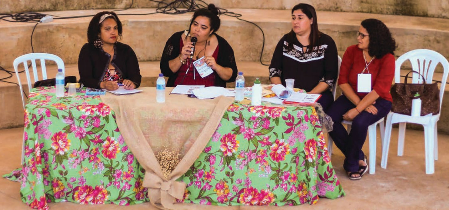
Roda de conversa: Identidade Ameaçada: discussão sobre a diversidade e a importância do patrimônio imaterial do Vale do Jequitinhonha por Sector Diamantina e COMPAC Itinga