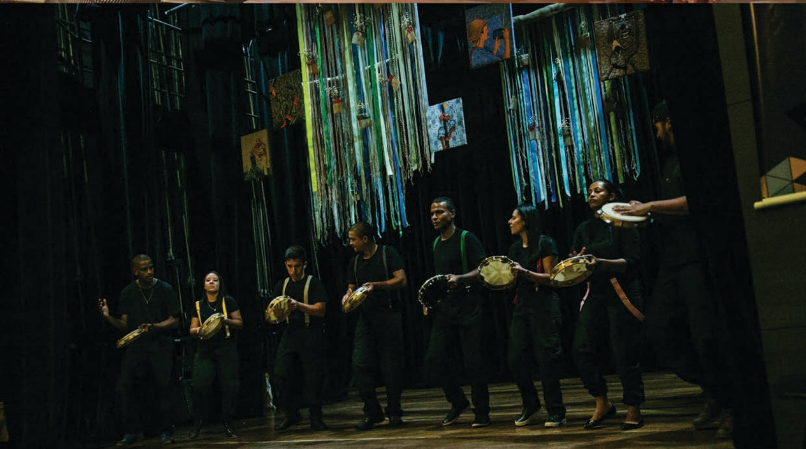
Grupo Yukerê Diamantina/MG