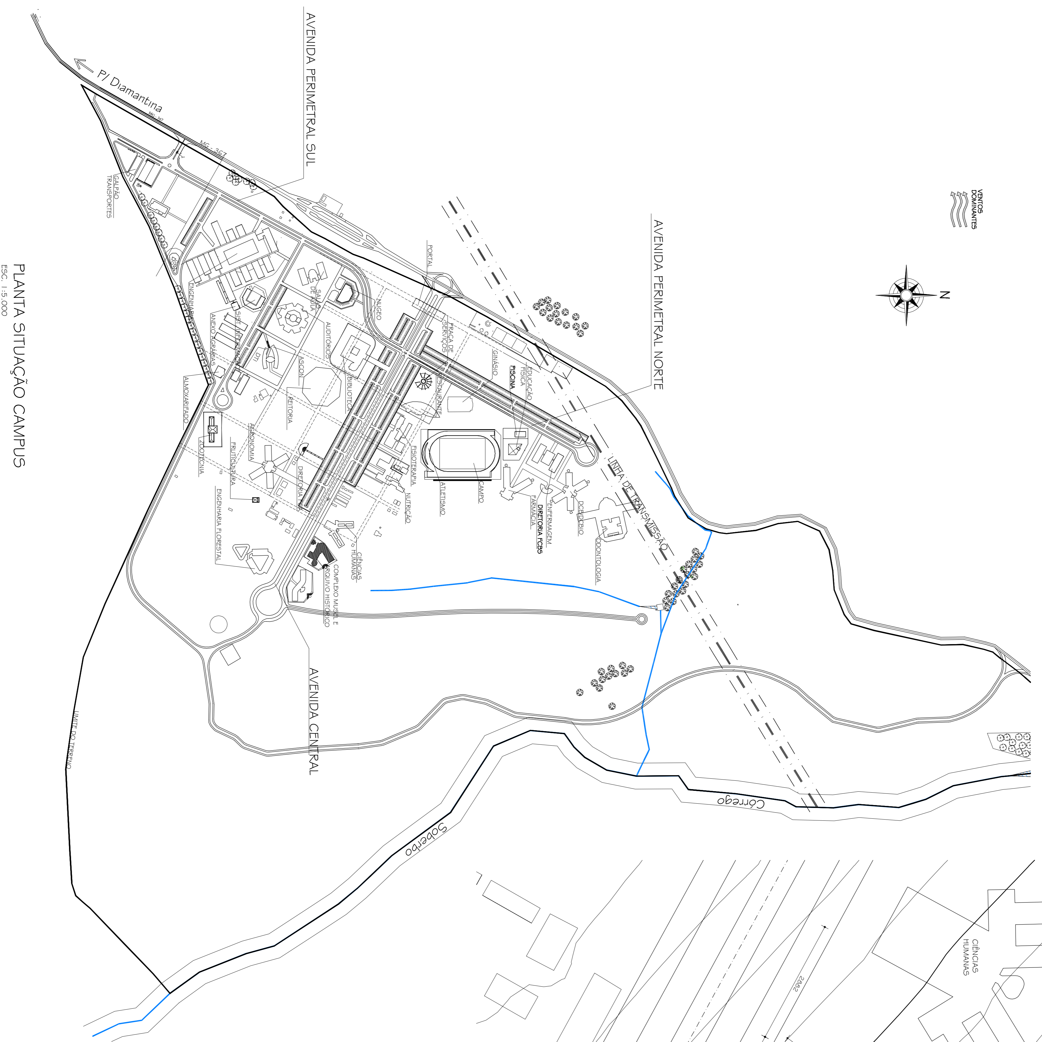
PLANTA SITUAÇÃO CAMPUS Esc. 1:5.000