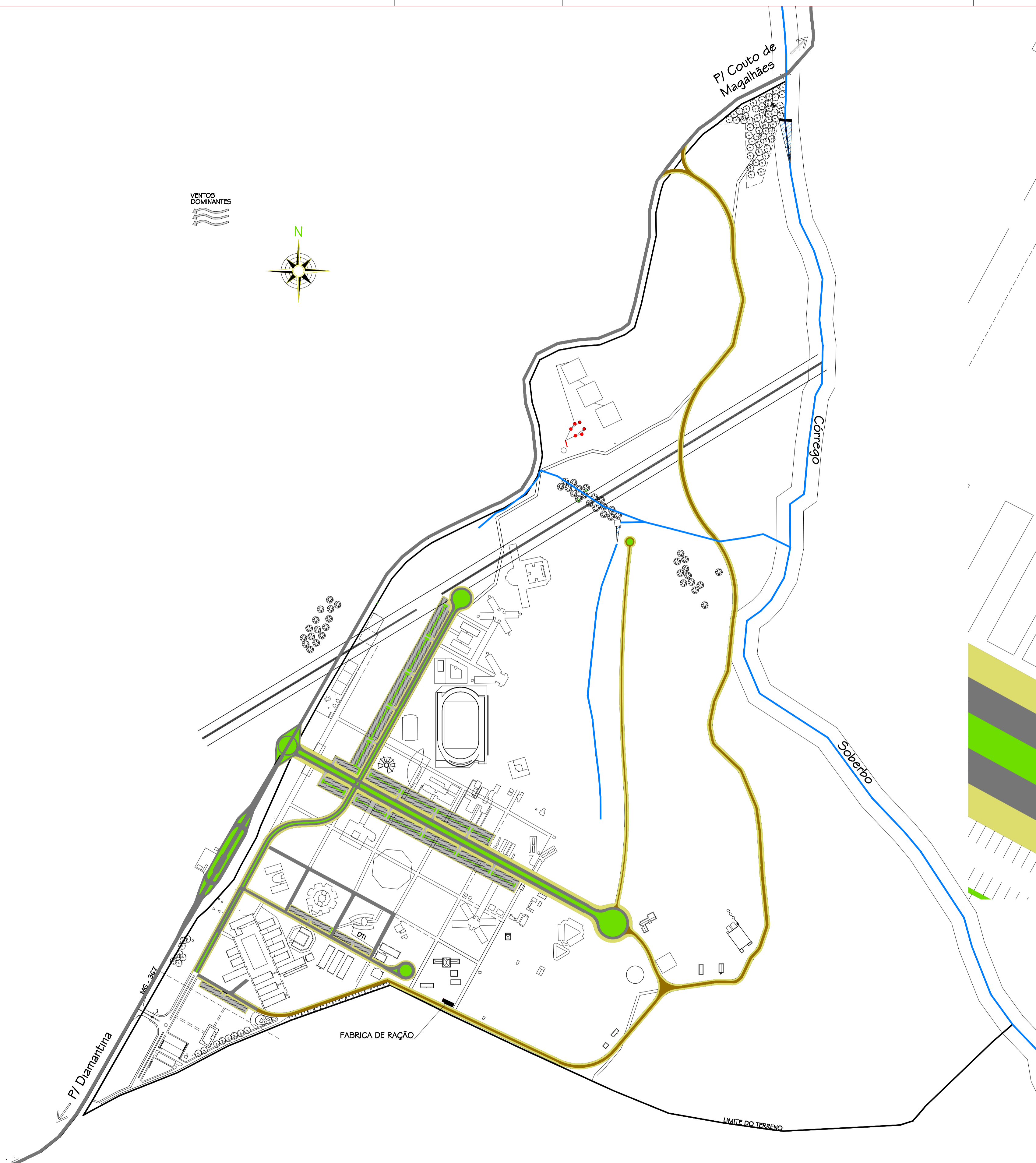
PLANTA SITUAÇÃO CAMPUS ESC. 1:5.000