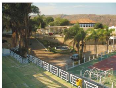
Centro Cultural do Campus I da UFVJM