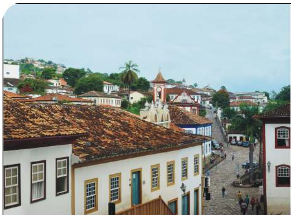
Vista parcial da cidade de Diamantina

A Instituição conta com 445 servidores, sendo cerca de 280 professores e 190 técnicos administrativos. Desde sua criação, a Universidade Federal dos Vales do Jequitinhonha e Mucuri vem desenvolvendo um importante trabalho de ensino, pesquisa e extensão, priorizando sempre a prestação de serviços às comunidades dos vales do Jequitinhonha e do Mucuri.