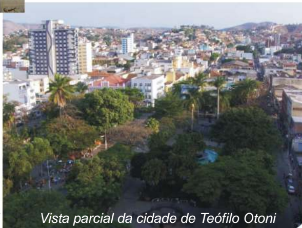
Vista parcial da cidade de Teófilo Otoni