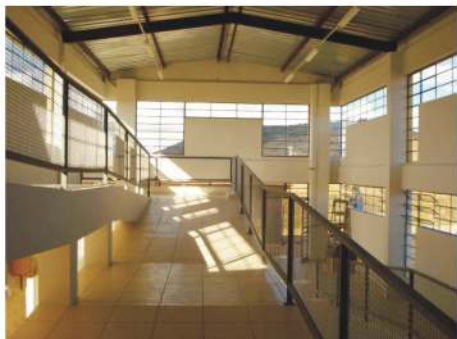
Vista interna de um prédio do Campus do Mucuri