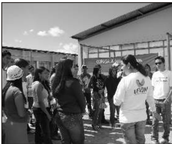
Alunos do Ensino Médio visitam as salas interativas das diversas áreas do conhecimento e assistem ao teatro do grupo PET Química

Outra grande atração no evento em Diamantina foi a apresentação do Bloco de Percussão Yuquerê do Conservatório Lobo de