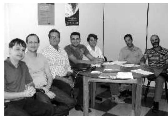
Profissionais que compõem o NITec

Os objetivos gerais do NITec são a prospecção tecnológica para identificar possíveis patentes; capacitação em Proteção Intelectual para os pesquisadores institucionais; regulamentação sobre propriedade intelectual; articulação visando o desenvolvimento de projetos em parceria; estímulo ao empreendedorismo e transferência de tecnologia. O mandato desse Núcleo irá trabalhar no mandato que vai de 19 de agosto de 2008 a 18 de agosto de 2010.