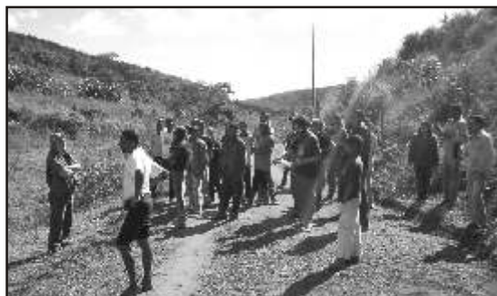
Moradores do Assentamento Aruega em treinamento no campo