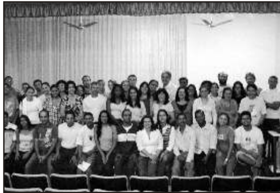
Educadores reunidos no Anfiteatro da UFVJM

De acordo com a coordenadora estadual do projeto, o objetivo central é desenvolver ações para a implementação de uma cultura em Direitos Humanos no sistema de ensino por meio da