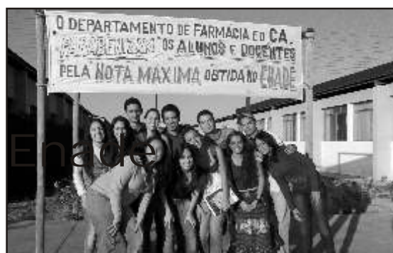
Alunos comemoram o resultado no Enade

Desenvolvido pelo Instituto Nacional de Estudos e Pesquisas Educacionais Anísio Teixeira (Inep), o conceito preliminar de curso é