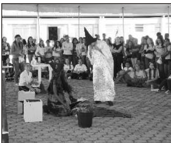
População de Teófilo Otoni e alunos do Ensino Médio se empolgam com as atrações