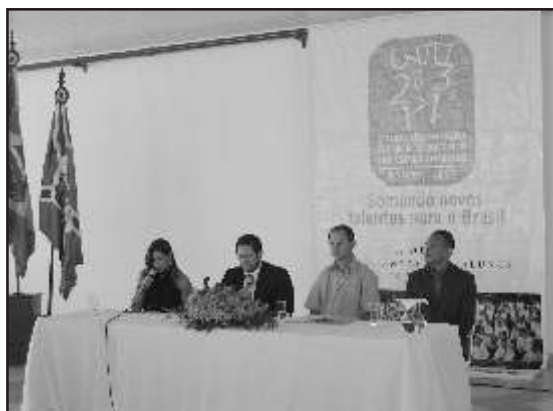
UFVJM torna-se palco das comemorações dos vencedores da Olimpíada Brasileira de Matemática das Escolas Públicas

Em Minas Gerais, 1.893.578 alunos de 3.870 escolas públicas foram inscritos, sendo que, na região MG08, 77.002 alunos pertencentes a