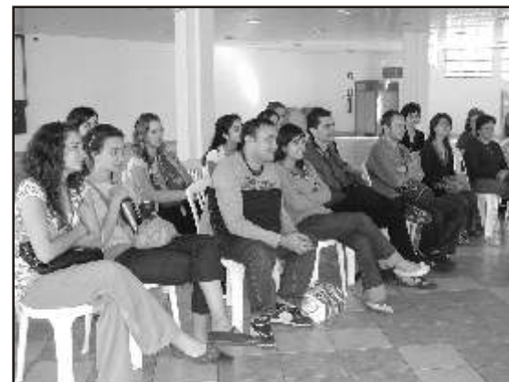
Os alunos estrangeiros durante abertura do curso

Essa atividade culminou com um encerramento festivo, na Praça do Mercado, reunindo alunos, professores e o público em geral, em animada roda de samba com os integrantes