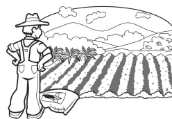
Programa de Apoio à Agricultura Familiar Coutense - UFVJM