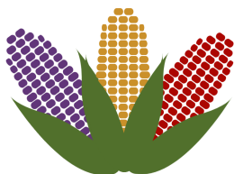
Projeto Milho Crioulo