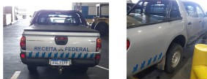
PAT 2781862 - 2013 - MANUAL - 32000KM