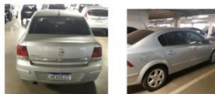
CAMBIO MANUAL ANO 2005/2007 POT 246381 último abastecimento 11/05/2023 1478878m CAMBIO 10000,00L