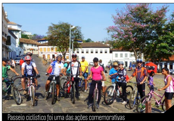
Passeio ciclístico foi uma das ações comemorativas

Há 10 anos, a Associação Internacional para a Prevenção do Suicídio (IASP) e a Organização Mundial da Saúde (OMS) propõem que o “Dia Mundial da Prevenção de Suicídios” - 10 setembro seja comemorado em todo o mundo. Em Diamantina, o Grupo Vida - Suicidologia da UFVJM tem proposto ações comemorativas desde 2009.