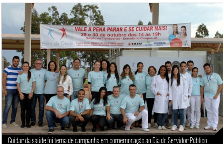
Cuidar da saúde foi tema de campanha em comemoração ao Dia do Servidor Público

Em comemoração ao Dia do Servidor Público, foi realizada, nos dias 29 e 30 de outubro de 2014, no Campus JK, a Blitz da Saúde, organizada pelo Programa Conviver / Pró-Reitoria de Assuntos Comunitários e Estudantis (Conviver / Proace), Caixa de Assistência à Saúde da Universidade (Casu) e Sindicato dos Trabalhadores das Instituições Federais de Ensino (Sindifes).