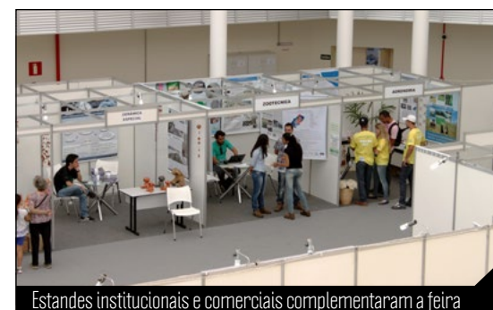
Estandes institucionais e comerciais complementaram a feira