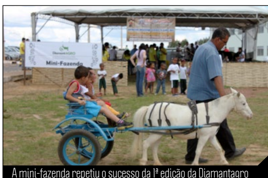
A mini-fazenda repetiu o sucesso da 1ª edição da Diamantagro

Mais de 500 produtores rurais e alunos da Escola Família Agrícola de 31 municípios do Vale do Jequitinhonha e região participaram dos 58 cursos oferecidos, nas diversas áreas do conhecimento, em especial de Ciências Agrárias, ministrados por professores e alunos de pós-graduação da UFVJM e por especialistas de instituições parceiras.