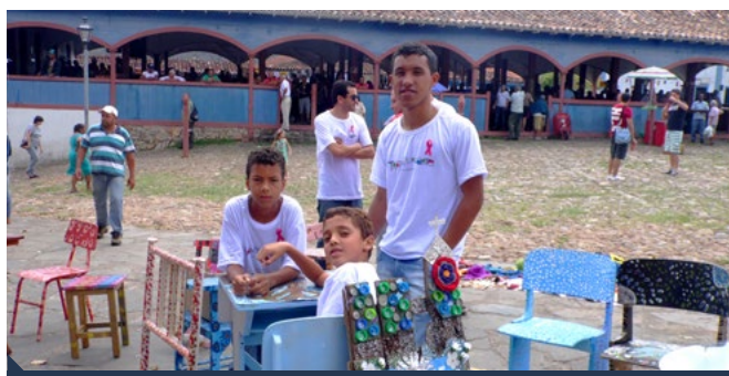
Projeto Transformarte marcou presença na Mostra de Projetos Culturais