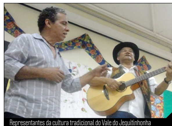
Representantes da cultura tradicional do Vale do Jequitinhonha

O IV Fórum de Saúde e Cultura foi uma realização da UFVJM, através do Grupo Jequi de Saúde Coletiva, Grupo de Estudos e Pesquisas dos Povos Indígenas de Minas Gerais, Mestrado Saúde, Sociedade & Ambiente, Grupo de Estudos sobre o Pensamento Complexo/NELAS, sob a coordenação da profª Sílvia Paes, da Faculdade de Ciências Biológicas e da Saúde (FCBS). Teve o apoio da Pró-Reitoria de Extensão e Cultura (Proexc), Pró-Reitoria de Pesquisa e Pós-graduação (PRPPG), Departamento de Ciências Básicas (DCB), curso de Nutrição da UFVJM, Associação dos Docentes da Universidade (ADUFVJM), Fundação de Amparo à Pesquisa do Estado de Minas Gerais (Fapemig), Fundação Oswaldo Cruz e Associação Brasileira de Saúde Coletiva.