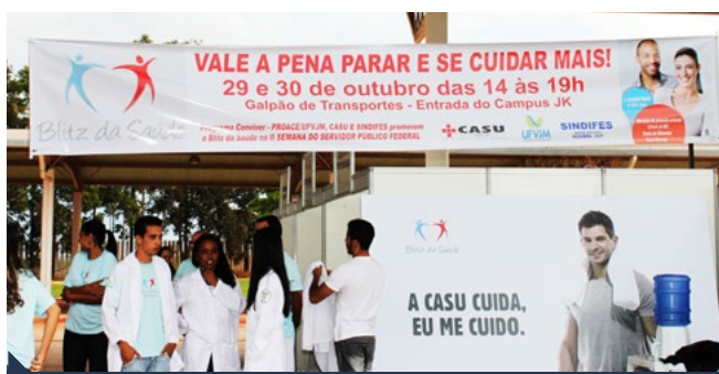
Mais de 200 pessoas participaram das atividades promovidas pela Blitz da Saúde