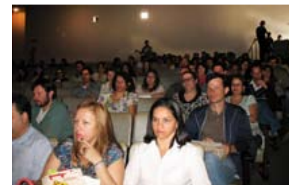
Técnicos administrativos e professores prestigiando o Forped