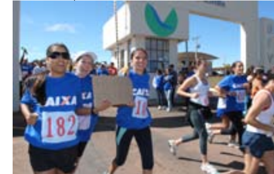
Atletas femininos iniciam a prova