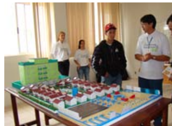
Curso de Administração exhibe cidade para explicar estrutura administrativa