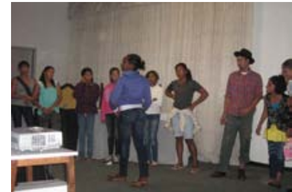
O grupo de teatro Arco-Íris apresenta peça sobre os três “R”

No mês de junho, a UFVJM realizou o evento de lançamento do Programa de Coleta Seletiva Solidária da instituição que tem como objetivo geral reduzir a quantidade do lixo produzido na Universidade, incentivar sua reutilização e reciclagem; colaborar com a melhoria da qualidade ambiental e promover ações de cidadania.