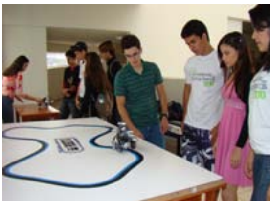
Alunos do BC&T do Campus do Mucuri fazem demonstração da disciplina Robótica