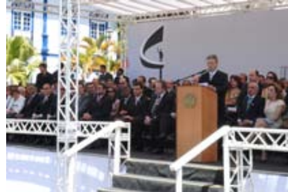
O governador de Minas Gerais, Antonio Anastasia, faz discurso na cerimônia da entrega da Medalha JK