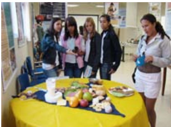
Curso de Nutrição monta pirâmide alimentar e orienta visitantes da 4ª edição da UPA