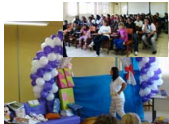
Visitantes lotam espetáculo produzido pela Biblioteca da UFVJM sobre o texto “A menina que não gostava de ler”