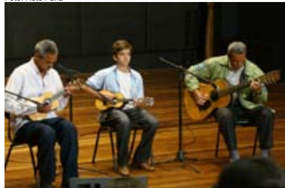
Grupo Reis do Choro se apresenta no Teatro Santa Izabel