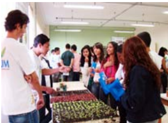
Curso de Agronomia faz demonstração sobre cultivo de hortaliças

Merecem destaque também os cursos das Ciências da Saúde e Ciências Agrárias, que possuem um apelo visual atraente com seus bonecos, esqueletos, peças anatômicas, animais vivos como os peixes, as codornas e as abelhas. Sementes, mudas e até dois robôs eletrônicos atraíram a atenção dos alunos que encantados com a realidade universitária deixaram vários bilhetes de agradecimento pela oportunidade e também de demonstração do desejo de serem alunos da UFVJM..