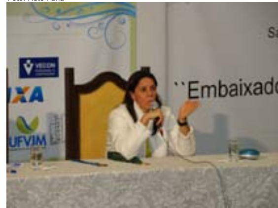
A ex-jogadora de vôlei de praia, Sandra Pires, medalha de ouro em olimpíadas, conta sua história na UFVJM, autografa camisetas e tira fotos com o público