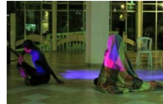
Representantes da comunidade fazem performance durante o Sarau Arte no Balde