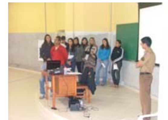
Apresentação do grupo que trabalhou o tema "Preconceito" no último dia dos Seminários