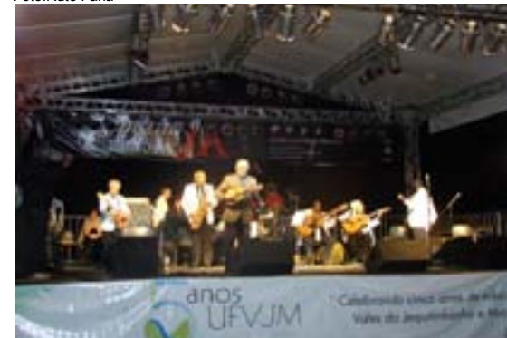
Grupo de seresta se apresenta na praça do Mercado Velho