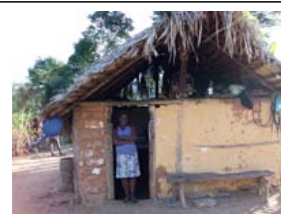
Moradora do Quartel de Indaiá, comunidade quilombola abordada pelo seminário sobre o tema "Identidade Cultural"