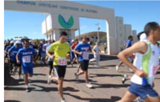
Atletas masculinos iniciam a prova