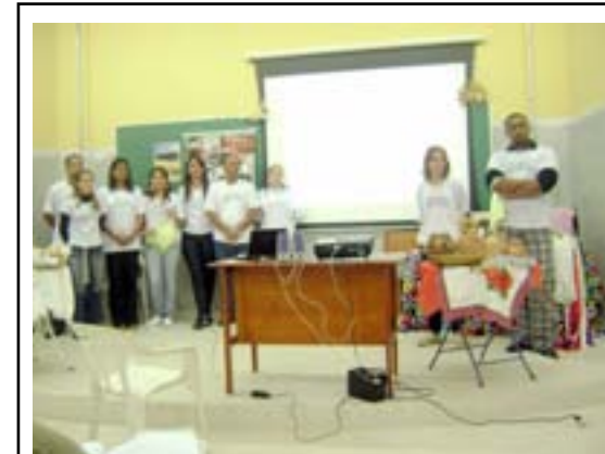
Alunos do BHu durante apresentação do seminário sobre o tema "Tradição e Modernidade" que abordou a história do Mercado Velho de Diamantina

- Preconceito: o seminário teve como objetivo analisar o que o preconceito gerou e gera na sociedade até os dias atuais. O estudo foi realizado em Diamantina, na UFVJM e em revistas e jornais. O tema foi escolhido devido à grande polêmica, discussão e divergências de opiniões que ele produz, além de ser um tema atual. O seminário também contou com pesquisa bibliográfica em artigos científicos e livros acadêmicos para esclarecimento do tema, compartilhando conceitos interdisciplinares trabalhados em sala de aula para construção de novos conhecimentos e maturação acadêmica.