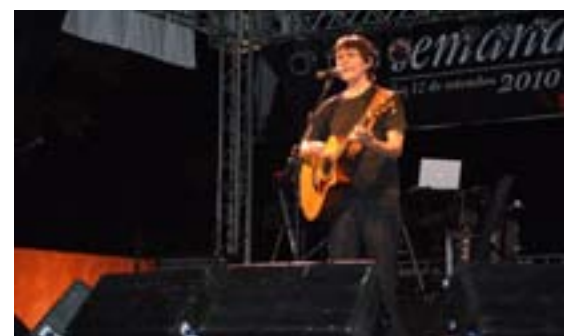
O cantor Lô Borges durante seu show na praça do Mercado Velho em Diamantina. Público prestigia o show.