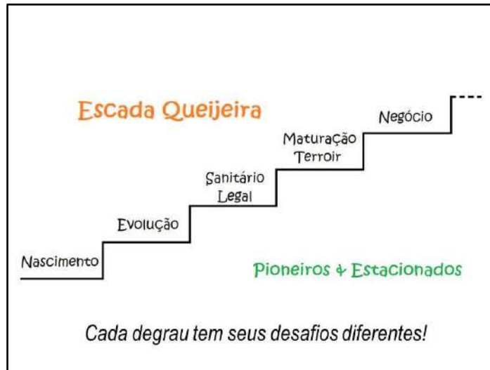
Figura: Escada Queijeira