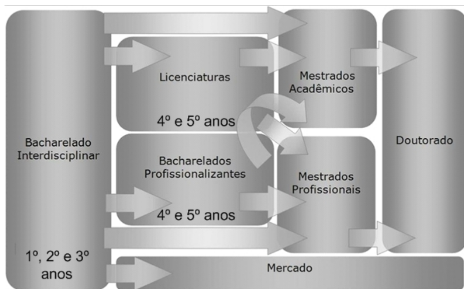
Figura 01 – Cronologia e possibilidades oferecidas pelo BHu.

MESTRADO - Primeiro nível de formação pós-graduada, etapa preliminar na obtenção do grau de doutor - embora não constitua condição indispensável à inscrição no curso de doutorado - ou grau terminal, com duração mínima de um ano, exigência de dissertação em determinada área do conhecimento em que o mestrando revele domínio do tema e capacidade de concentração, conferindo o diploma de mestre. Os mestrados obtidos no exterior, para que tenham validade no país, deverão ser reconhecidos por IES que ofereça programa de mestrado ou doutorado, reconhecido e avaliado, na mesma área de conhecimento. Além de aprofundar conhecimentos profissionais e acadêmicos, fornece instrumental para a execução de pesquisa em área específica. Já o MESTRADO PROFISSIONAL é dirigido à formação profissional, com estrutura curricular clara e consistentemente vinculada à sua especificidade, articulando o ensino com a aplicação profissional, de forma diferenciada e flexível, admitido o regime de dedicação parcial, exigindo a apresentação de trabalho final sob a forma de dissertação, projeto, análise de casos, performance, produção artística, desenvolvimento de instrumentos, equipamentos, protótipos, entre outras, de acordo com a natureza da área e os fins do curso. Fonte: http://www.ufmg.br/proplan/glossario/m.htm